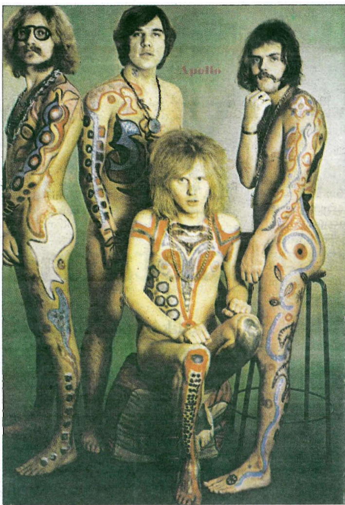
Psykedeeliset karvapääät eli Apollo-yhtye Stump-lehden takakannessa vuonna 1969. Vasemmalta Edward Vesala, Harri Saksala, Heimo Holopainen ja Eero Iupari.